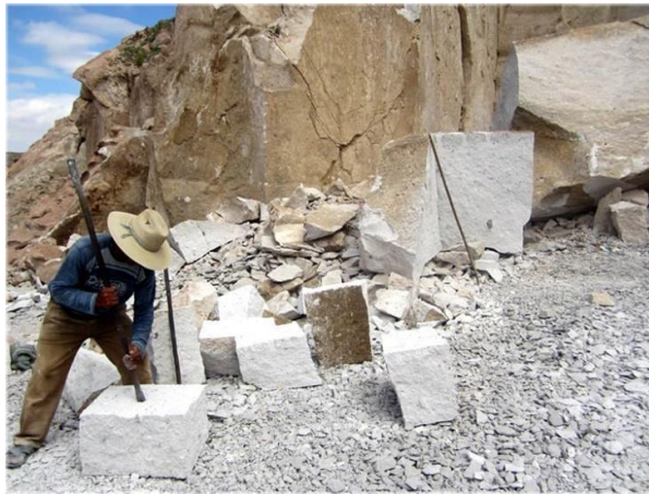
Imagen N° 2: Canteras de Sillar en Asociación José Luis Bustamante y Rivero

El distrito de Cerro Colorado presenta hasta cinco formaciones geológicas como depósitos piroplásticos (Qr-pi) que se asienta en gran parte del Cono Norte, volcánico sencca (Tp-vs2) cuya característica es de coloración rosado que cubre gran parte del territorio del distrito, volcánico barroso (Q-vba) que se localiza en la parte superior del aeropuerto, aluvial de acequia alta (Q-aaa) material predominante de arena y gravilla que se extiende en todo el aeropuerto y sus inmediaciones en dirección oeste, aluvial reciente (Qr-e) constituida por gravas de arenas gravosas que se encuentra básicamente en el área agrícola.